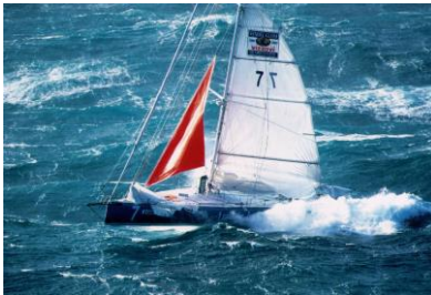
Le Vendée Globe - 85