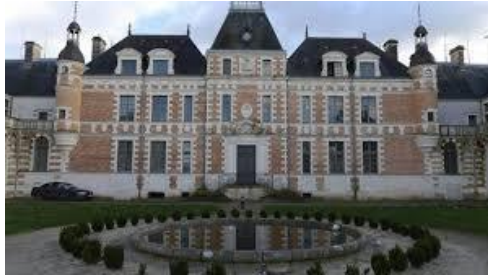
Château de Clermont, Le Cellier - 44