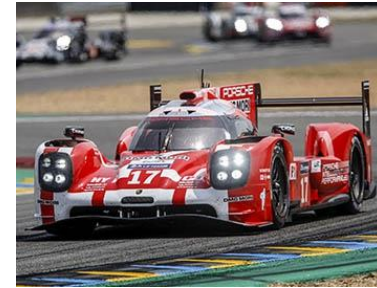
Les 24 Heures du Mans - 72