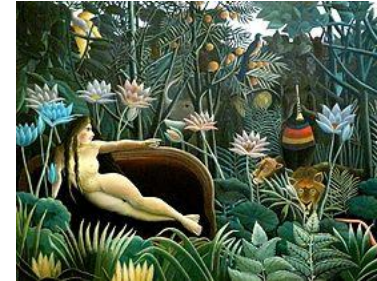
« Le rêve » Douanier Rousseau - 53